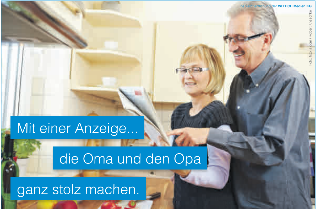
Eine Veröffentlichung der WITTICH Medien KG